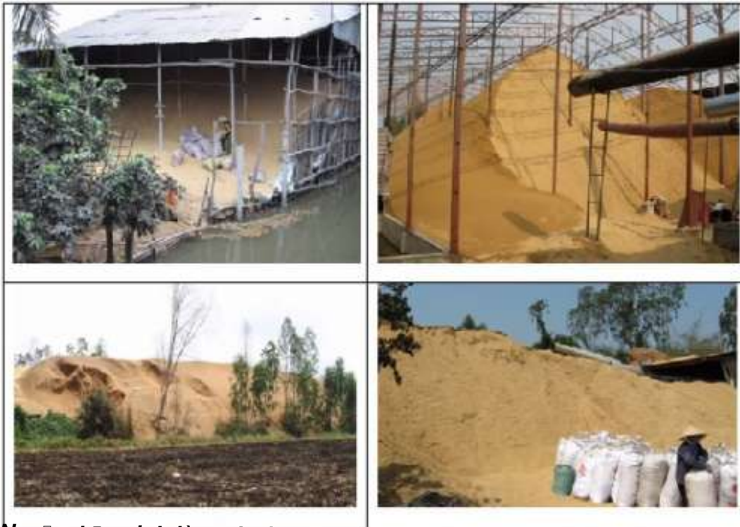
Nguyên liệu dùi dào tại các tỉnh ĐBSCL